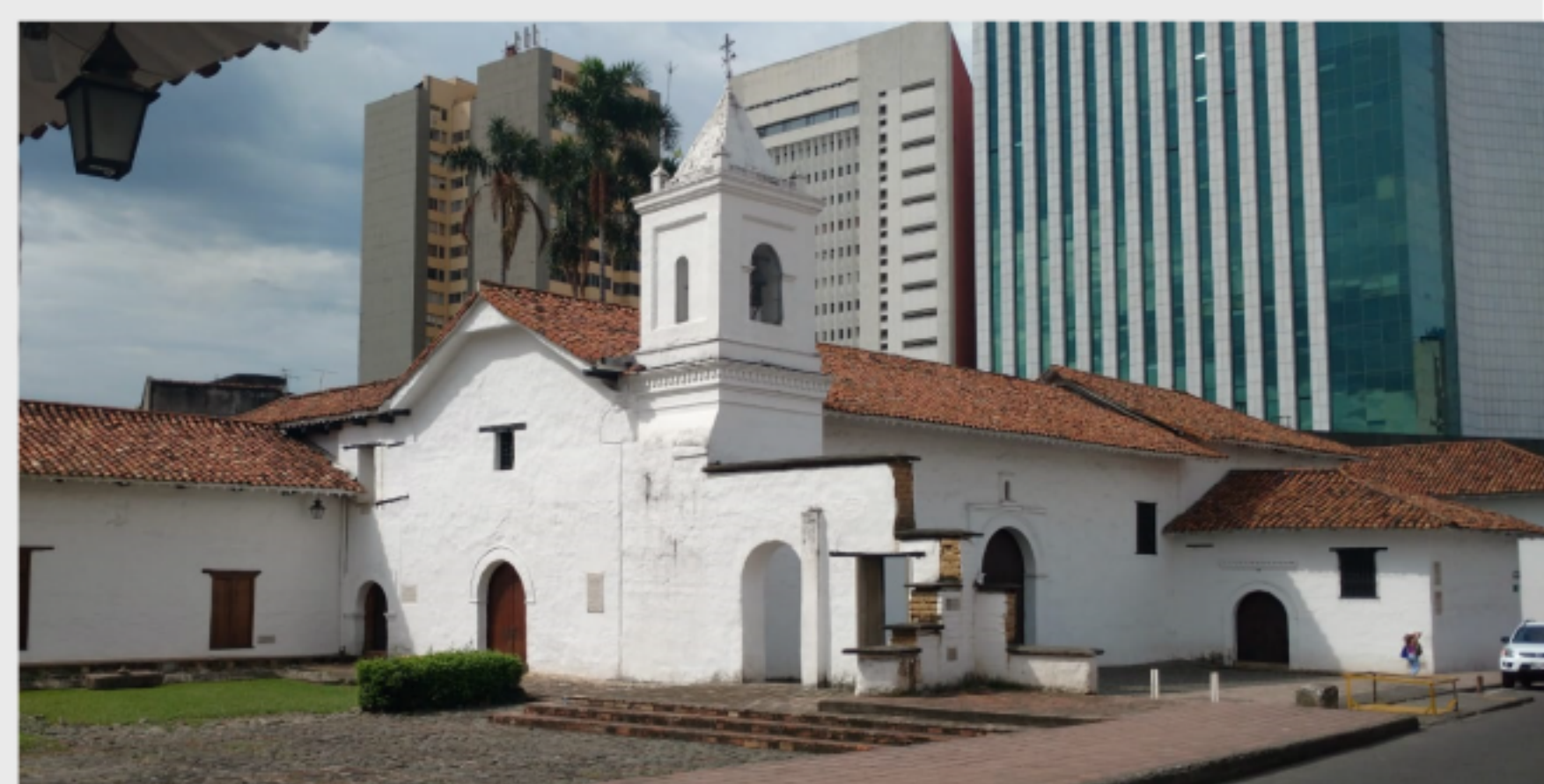
Iglesia La Merced.

No obstante al hablar de migraciones, vemos que Cali no sólo ha sido producto de migraciones humanas, sino también migraciones de fauna, especialmente aves que desde hace algún tiempo surcan los cielos de la ciudad. Como lo decía al inicio, el relieve de ésta y sus diversas temperaturas, hacen de ella el lugar ideal para que algunas aves migratorias, lleguen, aniden y se queden en Cali, ya que encuentran un ecosistema propicio para quedarse; como es el caso de la FIGUA, ave exótica e imponente que llegó a la zona urbana de Cali hace aproximadamente 14 años. Según algunos informes oficiales, ellas habitaban el Alto Anchicayá en el Parque Nacional Natural Farallones de Cali, pero aún se desconocen los factores que incidieron para que gran número de aves de esta especie, emigraran hacia algunas municipios aledaños. Su nombre científico es “Miilvago Chimachima” Miilvago significa ave rapaz