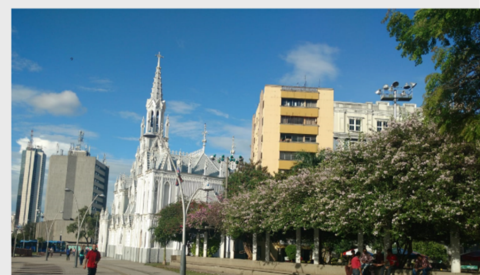
Boulevard del Río.