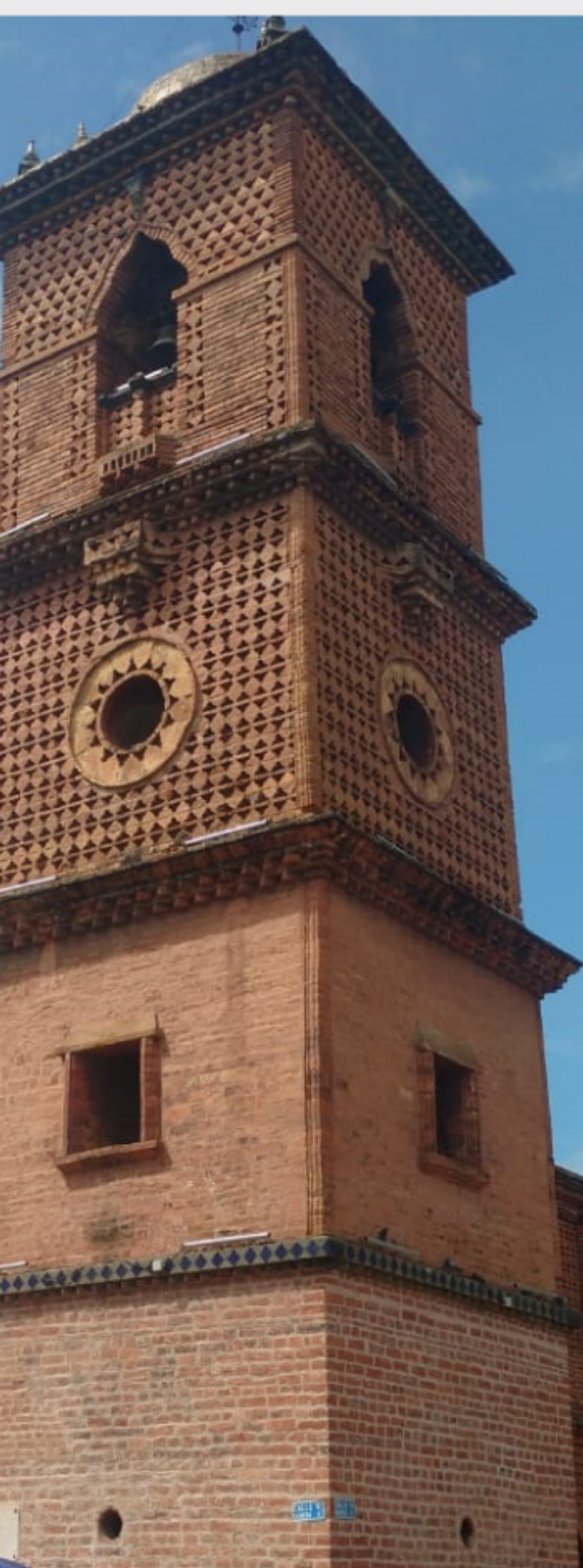
Iglesia de San Francisco.

“Además tengamos siempre presente que cada uno de los seres que habita este planeta, incluidos nosotros, no estamos aquí por simple casualidad, sino para cumplir un papel fundamental con nuestro espacio vital”.